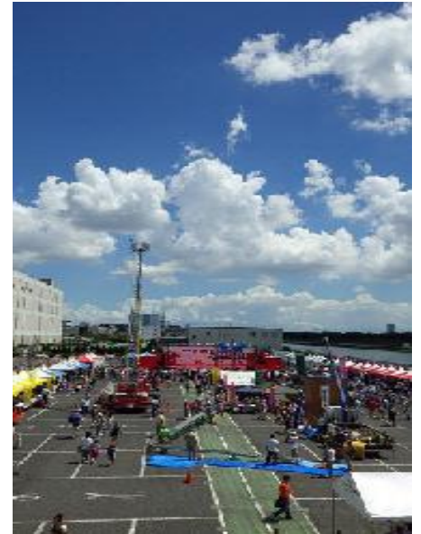
(去年のふるさと祭りの様子)