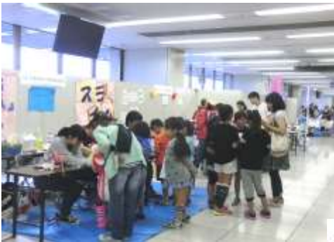
体験ブースは子ども達の列が