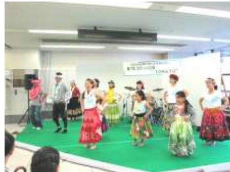
華やかなフラダンス 男性も参加