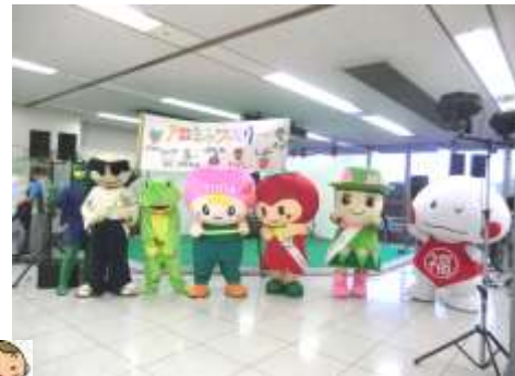
戸田キャラファミリー大集合☆