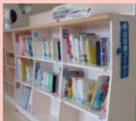
貸出図書コーナー