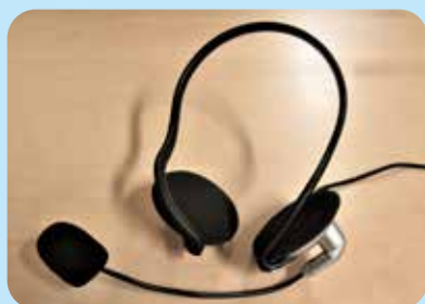
▲USBマイク付きヘッドホン