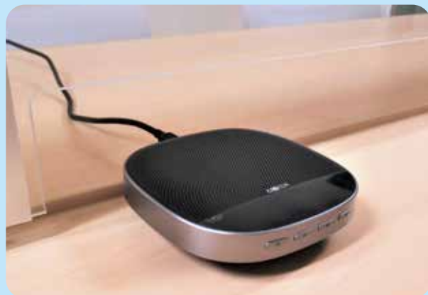
▲スピーカーフォン

マイクとスピーカーが一つになった機器です。Web会議などで、音声の聞こえづらさを解消します。