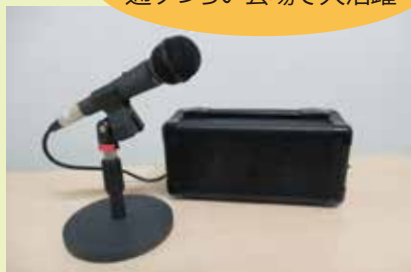
▲屋内用マイクセット&卓上スタンド