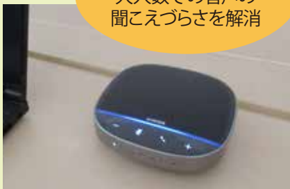
▲スピーカーフォン