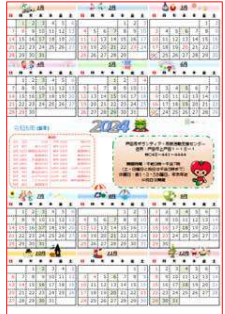
♥トマピーのイラスト入りカレンダーです。