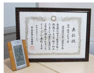
※表彰状と副賞の時計