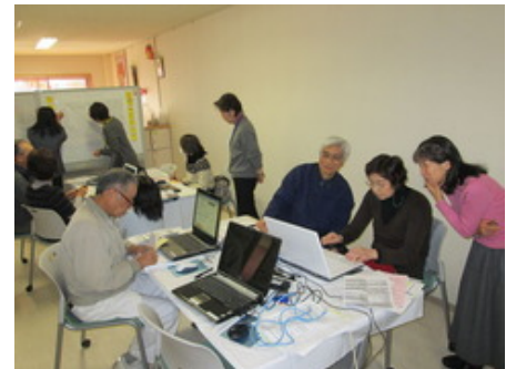
※前年の市民向け講座の様子