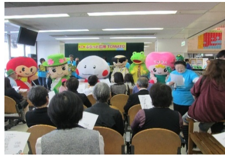
ラストステージ「♪花は咲く」を合唱！