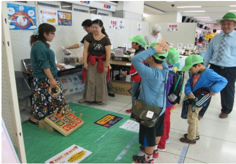
わなげコーナーは、子ども達に大人気！

有志団体による協働自主企画(古本市・わなげ・オークション)も大盛況！！収益は¥67,569となりました。台風第18号による大雨等災害義援金として、埼玉県共同募金会を通して全額寄付させていただきます。ご協力ありがとうございました。