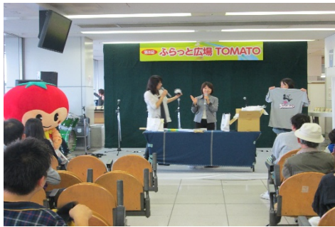
今年初企画！！オークション