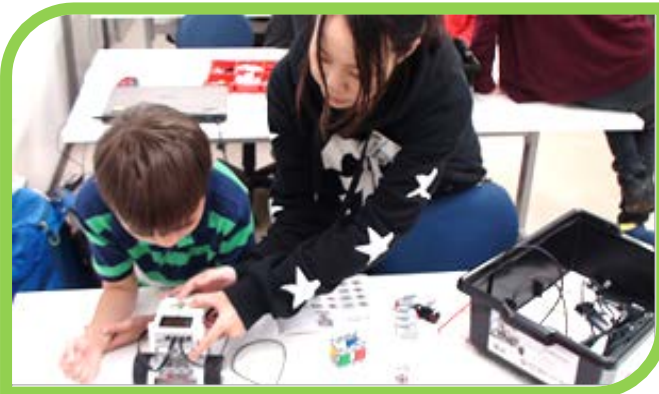
☆「レゴマインドストームEV3」でロボット体験