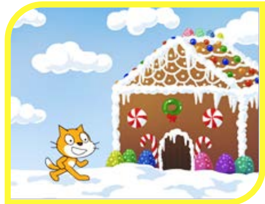
☆「スクラッチ」でプログラミング作成